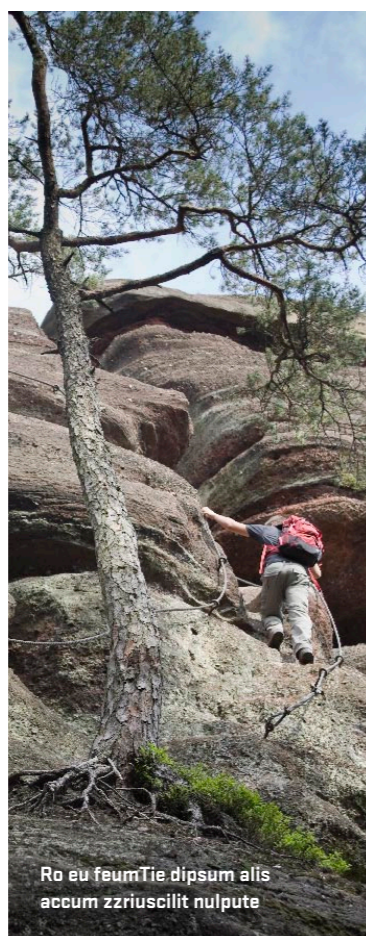
Ro eu feumTie dipsum alis accum zzriuscilil nulpute

het felgroene mos, ze doen het water glinsteren waar er stroomversnellinkjes zijn.