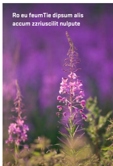
Ro eu feumTie dipsum alis accum zzriuscilil nulpute

'Können wir ein Foto von Ihnen nehmen?', klinkt het vanaf de overkant. Het zijn twee hijgende hardlopers. Zij in een rood shirt en zwarte broek, en hij ook. Uitgerend over dit kronkelende bospad, dat over meer boomstronken gaat dan je voor mogelijk kunt houden en waar muggen en vliegjes in groten getale roekeloos rondvliegen, zijn ze aan het hardlopen. Het kan niet anders dan dat ze hier vanwege het verkoelende beekje komen dat hier tussen de met mos begroeide oevers stroomt. Bundels zonlicht vallen er op